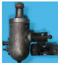
„DMM“ Astra, von August Hoessle